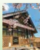
▲ヤビツ峠レストハウス