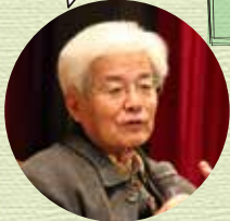
財団創立30周年記念講演の養老先生