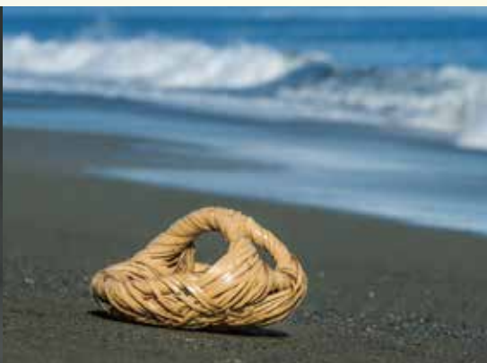
白錆竹花籠「うねり」