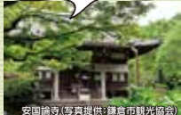
安国論寺 八幡先生が講師の古都鎌倉歴史探訪を開催します 4/23(水)9:30~12:30日運ゆかりの安国論寺や妙法寺などを巡ります

古都鎌倉の自然と歴史の素晴らしい環境を次の世代に残していってほしいですね。トラストさん、任せましたよ。