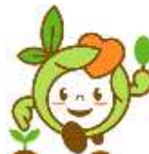
第61回全国植樹祭 シンボルマーク 「かなりんちゃん」

14:00以降は箱根登山バス(有料)利用 小田原駅西口行(いこいの森バス停より290円) 発車時刻 14:10、15:10、16:10、17:10