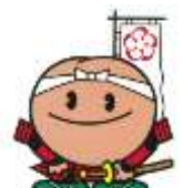
小田原市キャラクター 「梅丸」です。