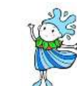
水源環境保全・再生 イメージキャラクター 「しずくちゃん」